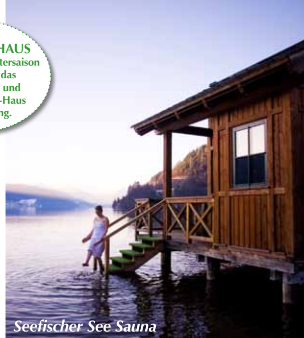
Seefischer See Sauna