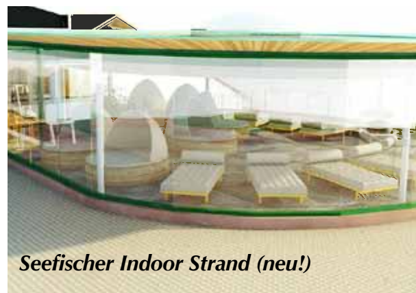
Seefischer Indoor Strand (neu!)